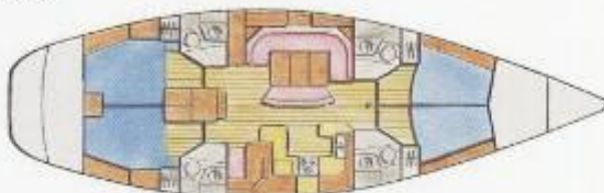
• 4 cabines