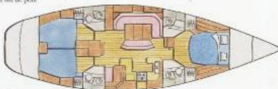
• 3 cabines