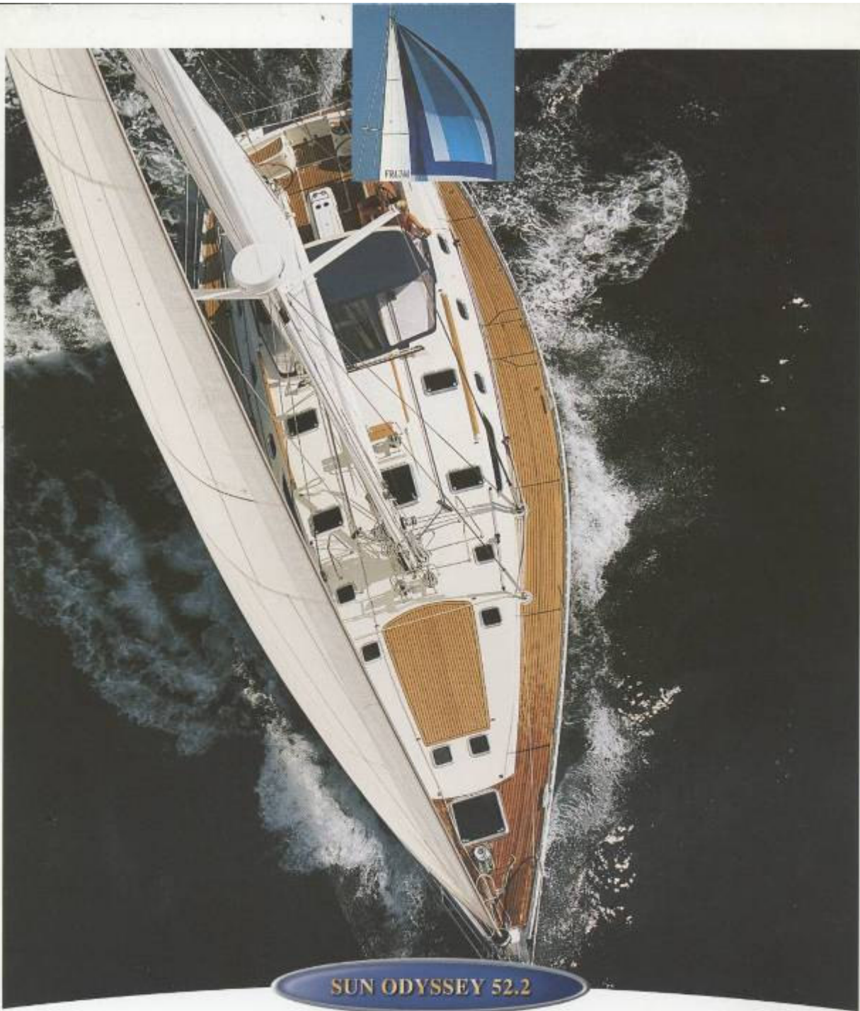
SUN ODYSSEY 52.2